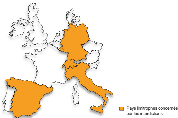
■ Pays limitrophes concernés par les interdictions